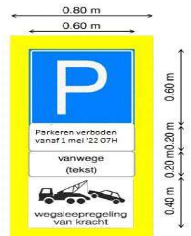
Figuur 1, voorbeeld bebording